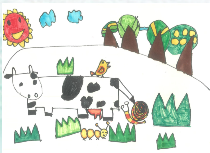
▲ 集团本部 黄媛媛之子方浩宇