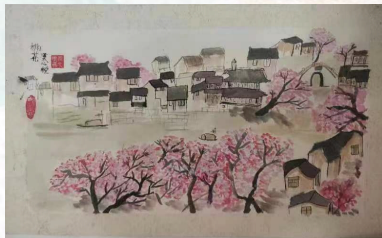
▲ 杭构集团 梁世教之女梁心悦