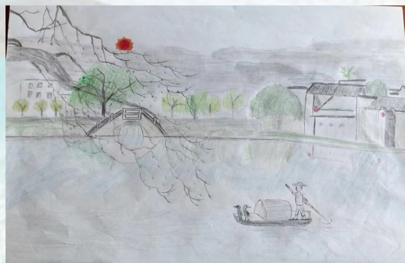
▲ 杭构集团 屠建强之子屠智康