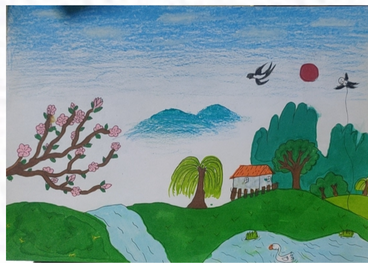
▲ 杭构集团 施芳英之女施乔伊