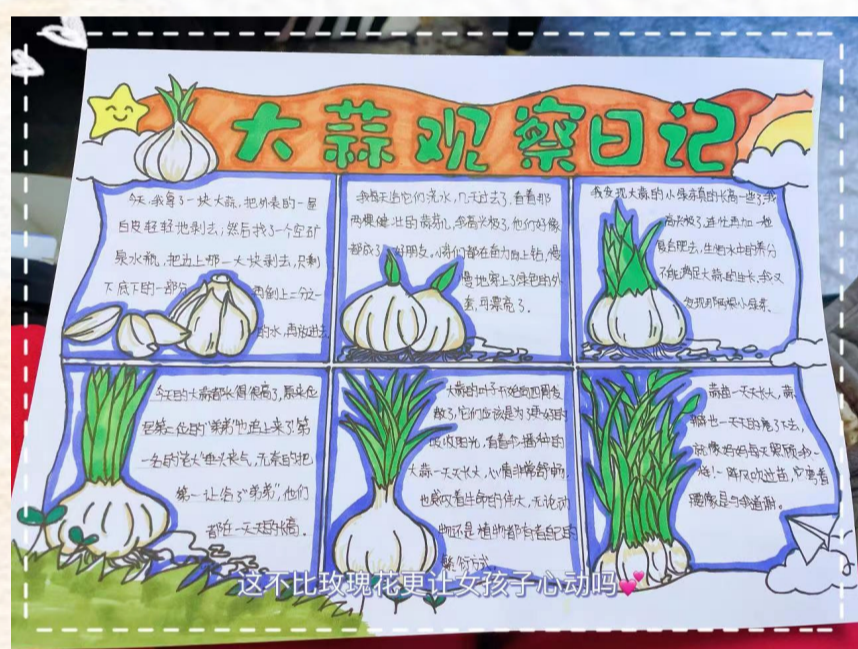
▲ 杭构集团 练惠梅之子申屠灏冉