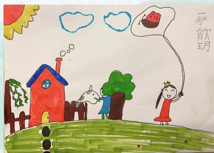
▲ 杭构集团 叶勇之女蔡昕玥