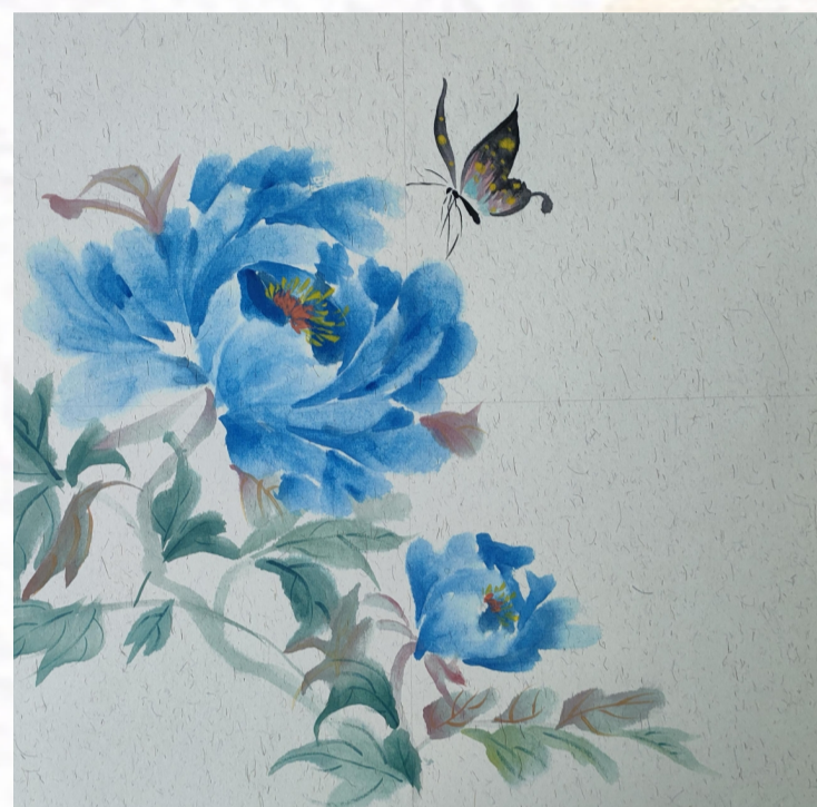
▲ 杭构集团 俞莉之女俞欣雨